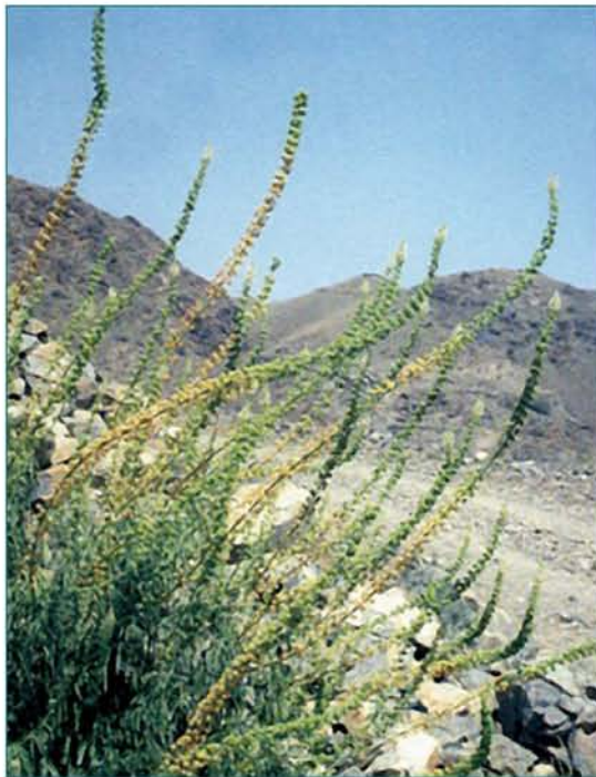
© Էլեոնորա Գաբրիելյան © Eleonora Gabrielyan