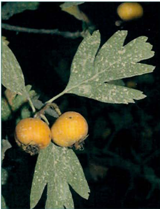
© Էլեոնորա Գաբրիելյան © Eleonora Gabrielyan