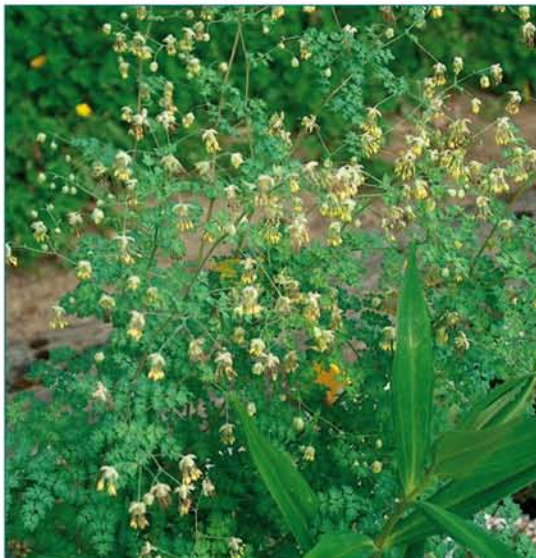
© Կամիլլա Թամանյան © Kamilla Tamanyan

Կարեգործիչ: Խոցելի տեսակ է: Հայաստանում գտնվում է ընդհանուր տարածման հյուսիսային սահմանում: Տարածման շրջանի մակերեսը 5000 քառ. կմ-ից պակաս է, բնակության շրջանի մակերեսը՝ 500 քառ. կմ-ից պակաս: Տեսակին սպառնում է տարածման և բնակության շրջանների կրճատում՝ աճերավայրերի պայմանների փոփոխության պատճառով: Տեսակի հիմնական տարածման շրջանը գտնվում է Հայաստանի սահմաններից դուրս, հետևաբար սպառնալիքի կատեգորիան նվազեցված է մինչև VU: