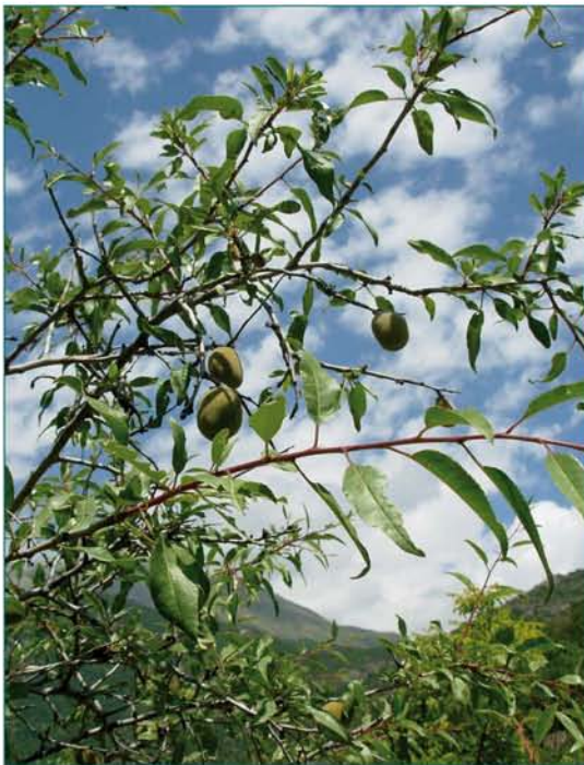
© Մարինե Հովհաննիսյան © Marine Oganessian