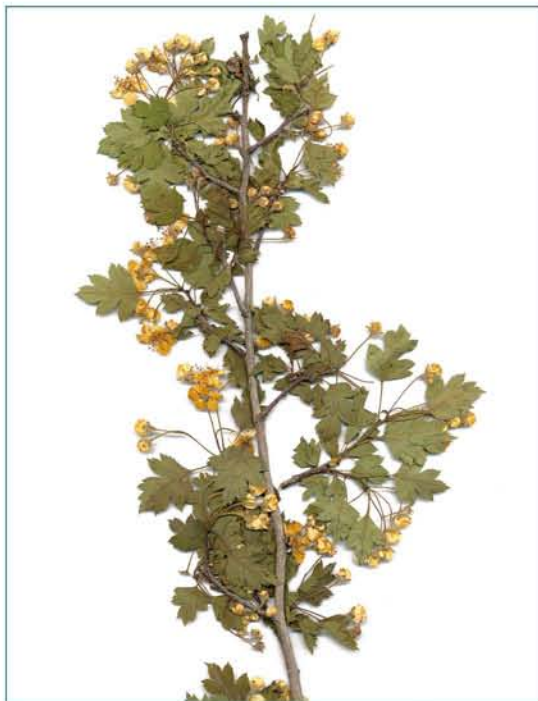
© ՀՀ ԳԱԱ Բուսաբանության ինստիտուտի հերբարիում © Herbarium of the Institute of Botany of NAS of Armenia

Պահպանության միջոցառումներ: Պաշտպանության մի մասը պահպանվում է «Շիկահոօ» պետական արգելոցի տարածքում: Անհրաժեշտ է իրականացնել պաշտպանության վիճակի մոնիթորինգ: