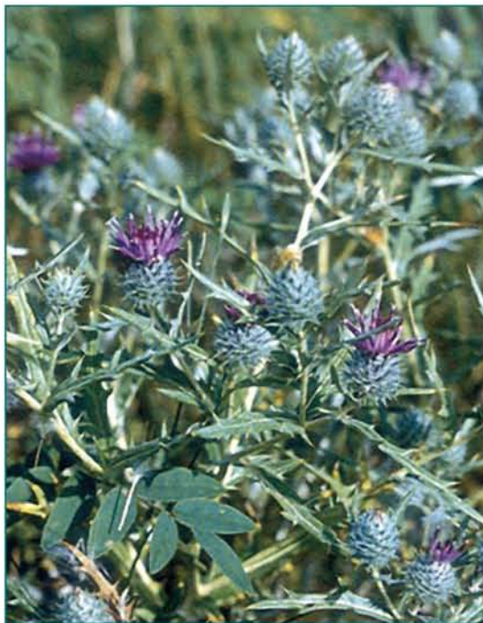
© Էլեոնորա Գաբրիելյան © Eleonora Gabrielyan

Հայաստանի ԳԱԱ Բուսաբանության ինստիտուտի, Ռուսաստանի ԳԱ Վ. Լ. Կոմարովի անվան Բուսաբանության ինստիտուտի, Վրաստանի ԳԱ Բուսաբանության ինստիտուտի հեքարխիվումների նյութեր Herbarium materials of the Institute of botany of NAS RA V. L. Komarov's Botanical institute of AS RF, Institute of Botany of AS of Georgia.