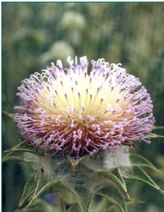
© Էլեոնորա Գաբրիելյան © Eleonora Gabrielyan

Հայաստանի ԳԱԱ Բուսաբանության ինստիտուտի, Ռուսաստանի ԳԱ Վ. Լ. Կոմարովի անվան Բուսաբանության ինստիտուտի, Վրաստանի ԳԱ Բուսաբանության ինստիտուտի հերբարիումների նյութեր Herbarium materials of the Institute of botany of NAS RA V. L. Komarov's Botanical institute of AS RF, Institute of Botany of AS of Georgia.