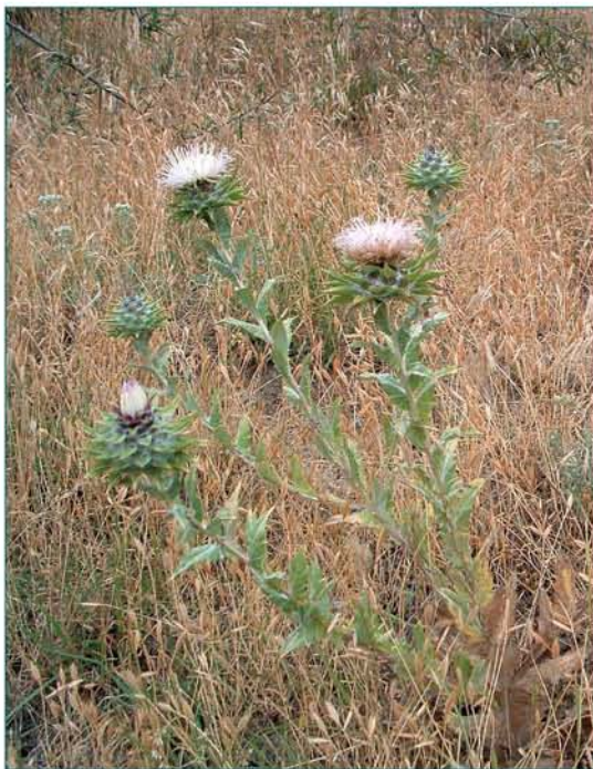
© Էլեոնորա Գաբրիելյան © Eleonora Gabrielyan