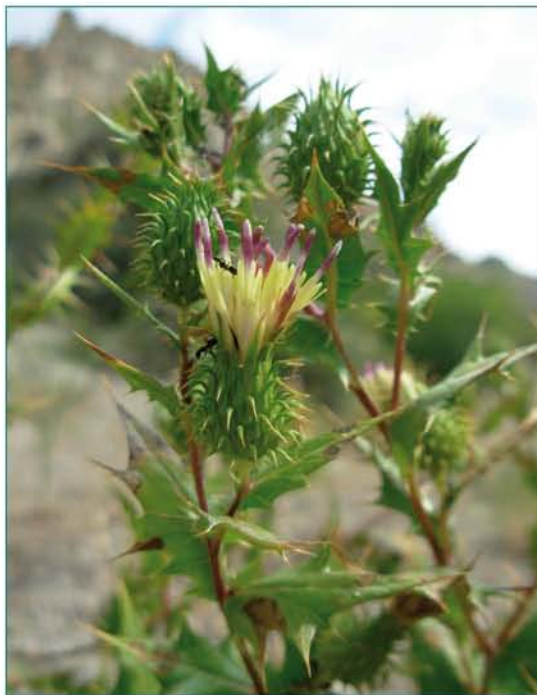
© Մարինե Հովհաննիսյան © Marine Oganesian

Հայաստանի ԳԱԱ Բուսաբանության ինստիտուտի, Ռուսաստանի ԳԱ Վ. Լ. Կոմարովի անվան Բուսաբանության ինստիտուտի, Վրաստանի ԳԱ Բուսաբանության ինստիտուտի հերբարիումների նյութեր Herbarium materials of the Institute of botany of NAS RA V. L. Komarov's Botanical institute of AS RF, Institute of Botany of AS of Georgia.