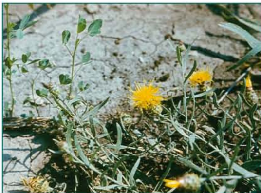
© Կամիլլա Թամանյան © Kamilla Tamanyan

Կարեգործիչ: Կրիտիկական վիճակում գտնվող տեսակ է: Հայաստանի էնդեմիկ է: Հայտնի է մեկ ֆլորիստիկական շրջանից, որտեղ հանդիպում է չափազանց հազվադեպ, ինտենսիվ յուրացվող տեղերում: Տարածման և բնակության շրջանների մակերեսը 10 քառ. կմ–ից պակաս է: