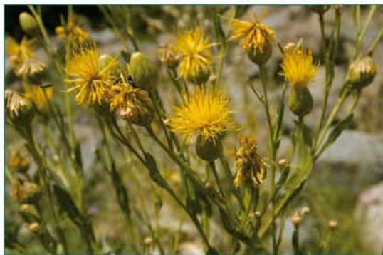
© Կամիլյա Թամանյան © Kamilla Tamanyan

Կարեգործիչ: Կրիտիկական վիճակում գտնվող տեսակ է: Հայաստանի էնդեմիկ է: Տարածման և բնակության շրջանների մակերեսը 10 քառ. կմ-ից պակաս է: Տեսակը աճում է ինտենսիվ գյուղատնտեսական գործունեության գոտում: